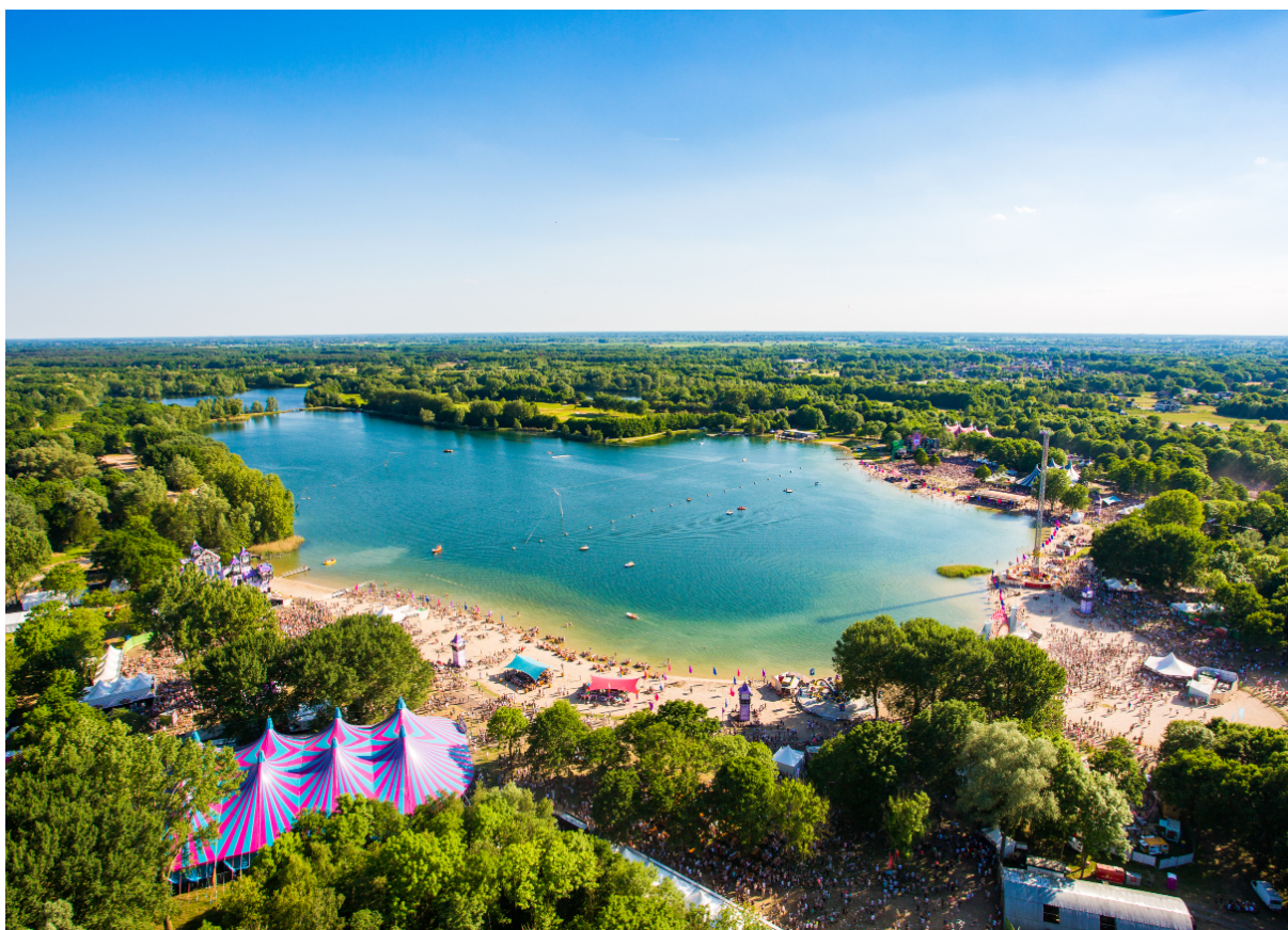
Emporium festival 2017

De opbrengst uit evenementen betreft de verhuur van delen van onze recreatiegebieden aan organisatoren van evenementen. Wij verzorgen zelf niet de organisatie van deze evenementen.